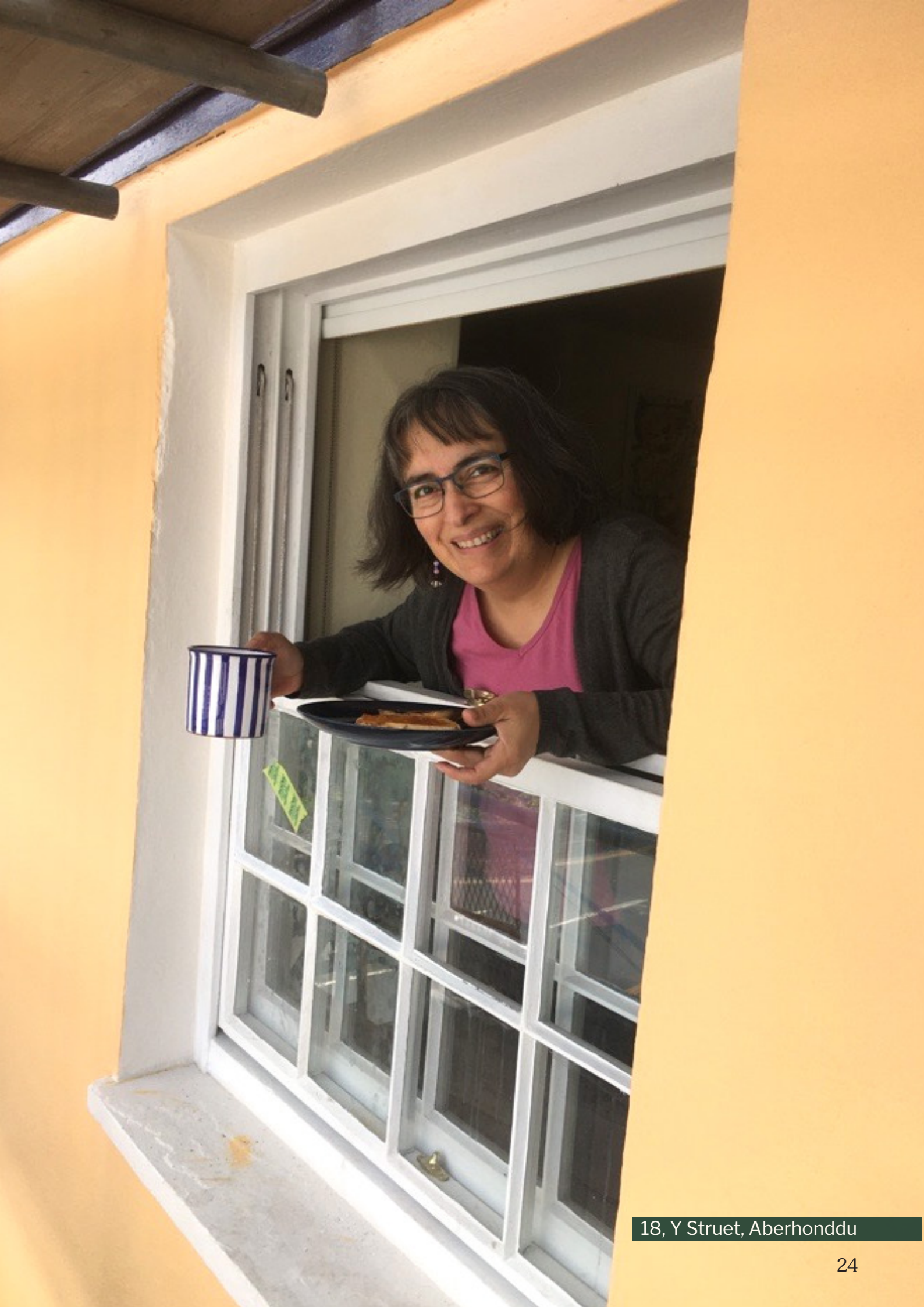
18, Y Struet, Aberhonddu