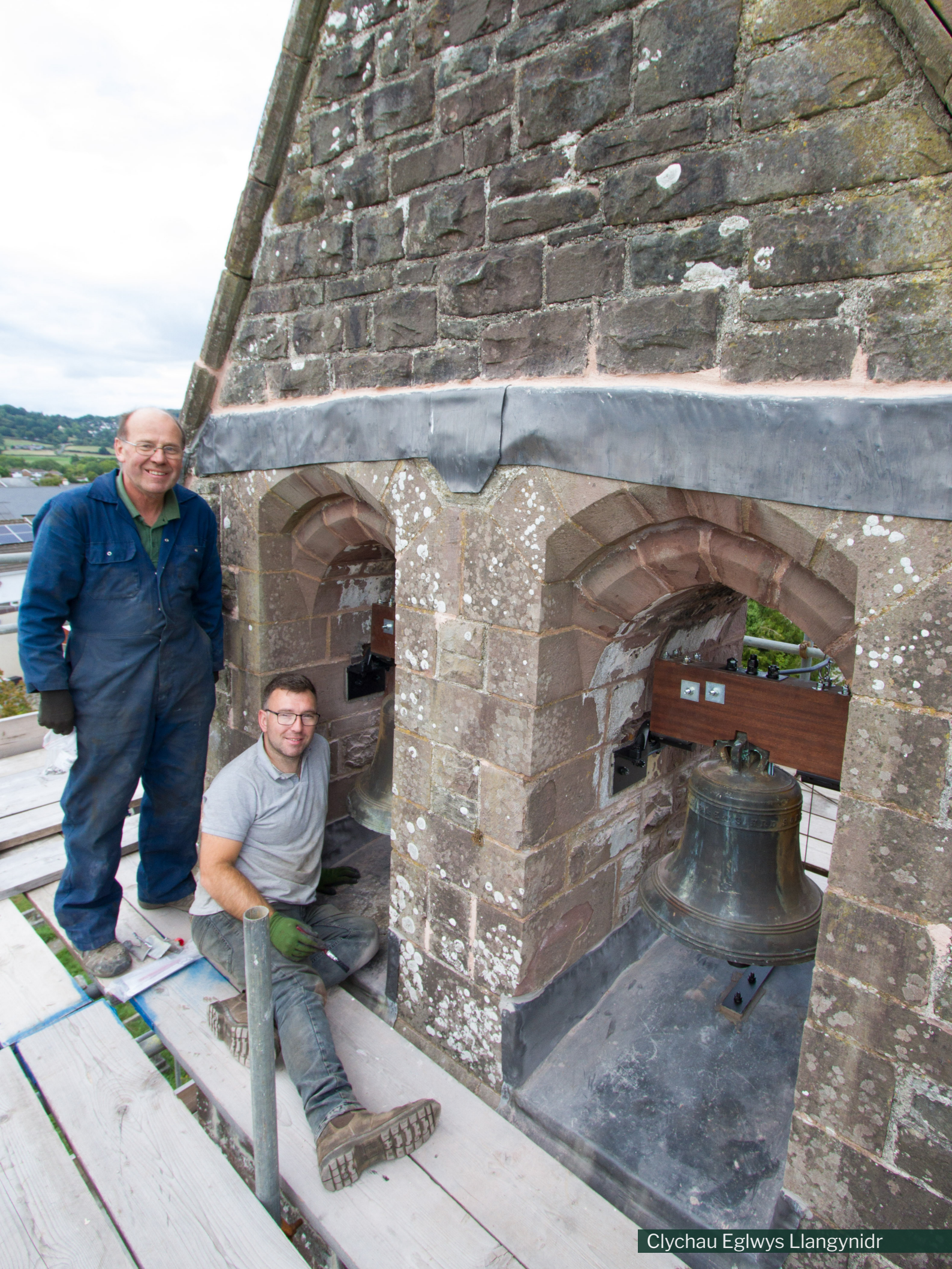
Clychau Eglwys Llangynidr