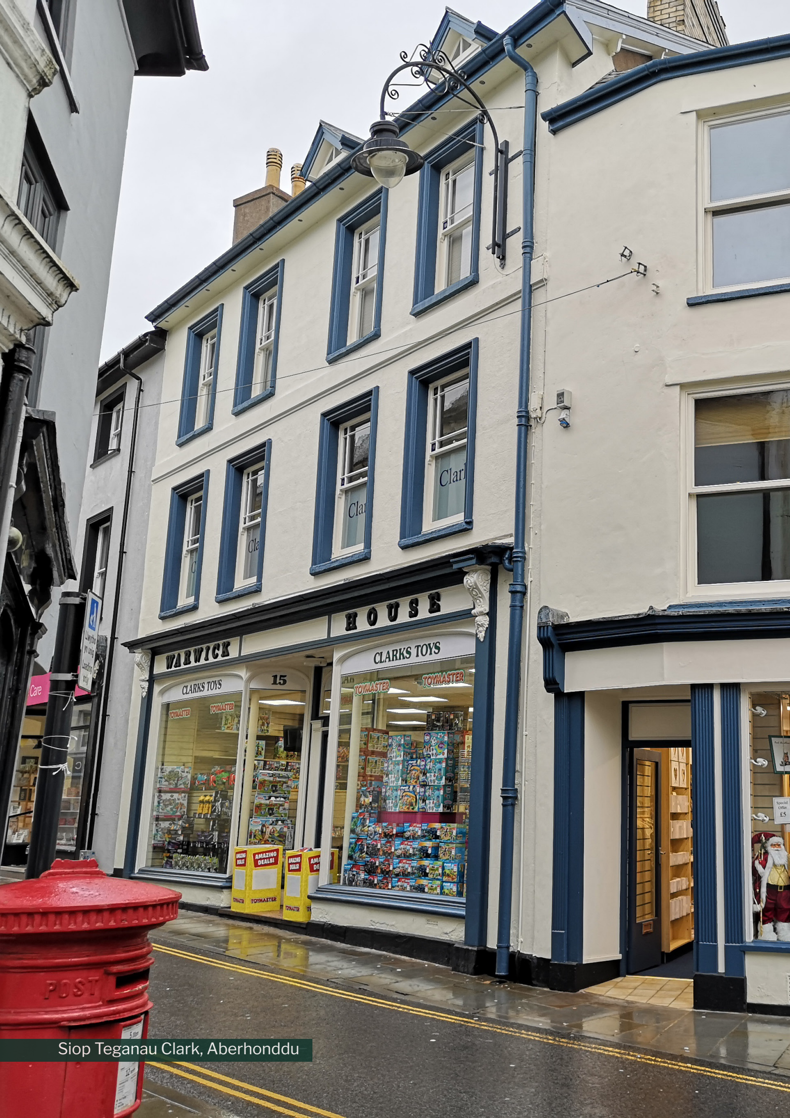
Siop Teganau Clark, Aberhonddu